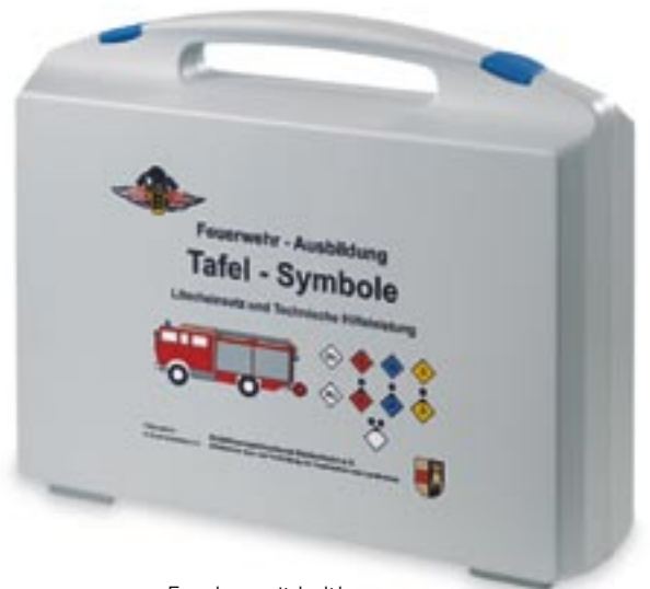
Eurobag mit haltbarem, mehrfarbigem Aufdruck.

○ ist nicht möglich. *zusätzlich lieferbar Aus technischen Gründen kann es zu geringfügigen Maßunterschieden kommen.