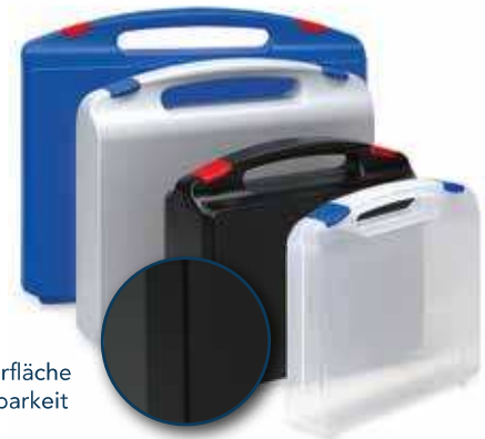
feine Strukturoberfläche für gute Bedruckbarkeit