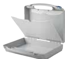
Zwischenplatte für Eurobag