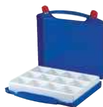
Standardtiefzieheinsätze für Kleinteile in diversen Größen

* weitere Farben & Kombinationen auf Anfrage