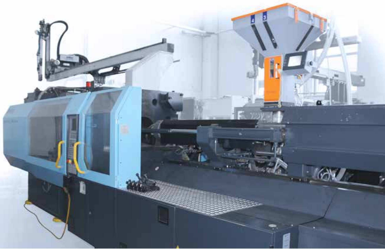
Spritzgussmaschine zur Herstellung einwandiger Koffer.