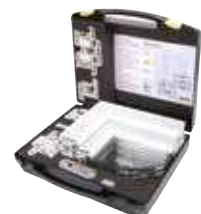
Koffer mit Verschlüssen in Sonderfarbe und kundenspezifischem Schaumstoffeinsatz