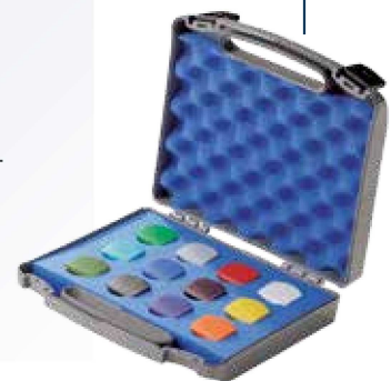
Eine Auswahl möglicher Verschlussfarben