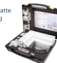
Koffer mit Verschlüssen in Sonderfarbe und kundenspezifischem Schaumstoffeinsatz