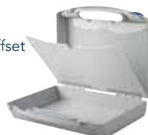
Zwischenplatte für Eurobag