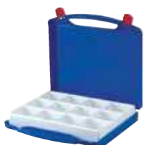
Standardtiefeinsätze für Kleinteile in diversen Größen

* weitere Farben & Kombinationen auf Anfrage