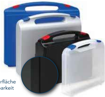
Feine Strukturoberfläche für gute Bedruckbarkeit